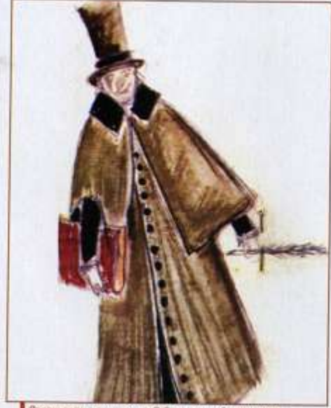
CROQUI PARA O FIGURINO DE O Barbero de Sevilha , 1981.