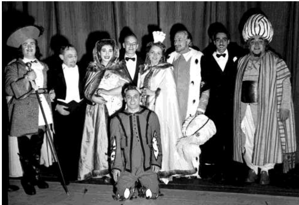
Il Ratto del Serraglio 1951 Scala de Milão