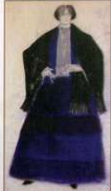
CROQUI PARA Challena Rostodana , 1979.