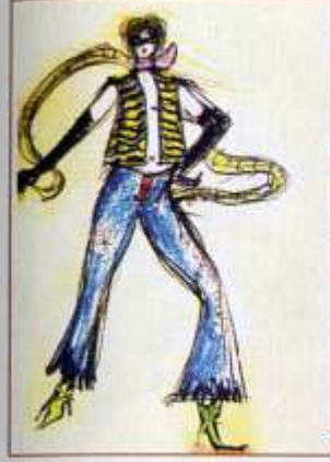
CROQUI PARA O FIGURINO DA GATA EM Os Salmirancos , 1977.