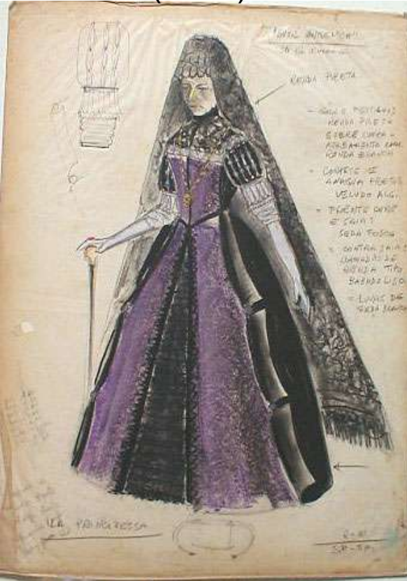
SUOR ANGELICA (1981)