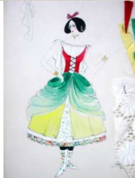
ELIXIR DE AMOR (1971)