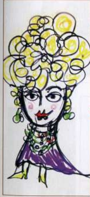
CROQUI PARA O FIGURINO DA MULHER DO BARRIO EM Os Salmirancos , 1977.