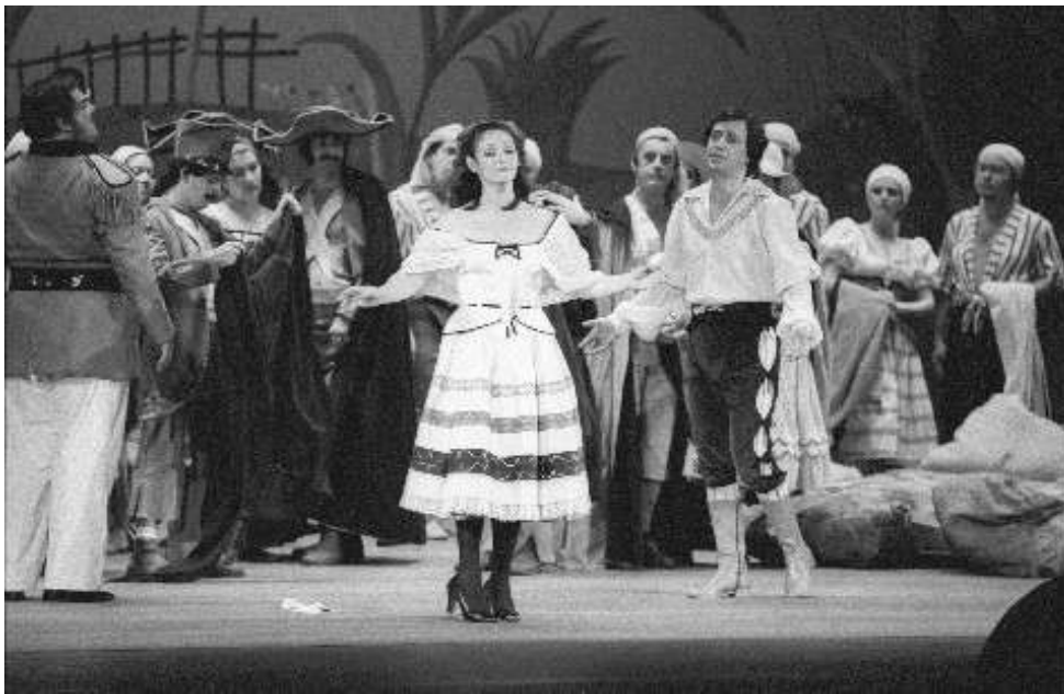
Elixir de Amor 1983 Teatro Municipal - RJ