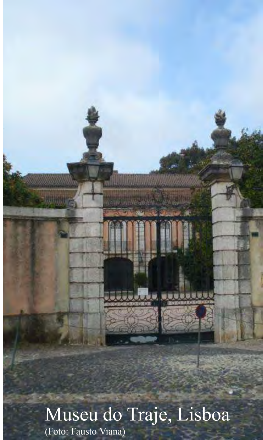
Museu do Traje, Lisboa

Projeto de pós- doutorado com base no Museu do Traje de Lisboa, Portugal