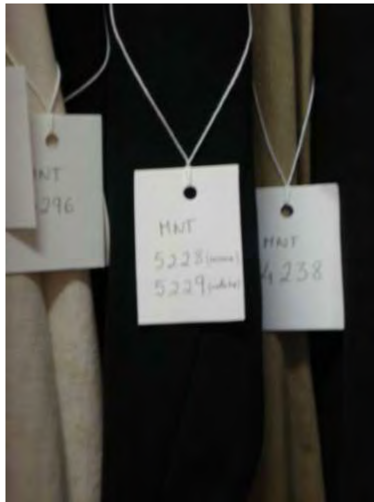
Detalhe das etiquetas