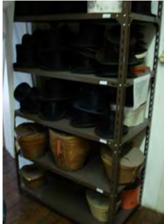
Prateleira com chapéus

Uma curiosa peça- um colete ainda por ser montado