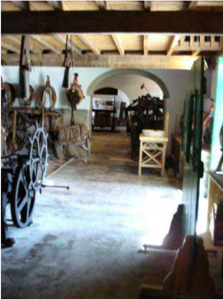
Sala “etnográfica” e varanda do Museu