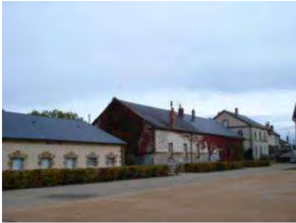
Centro Nacional do Traje de Cena