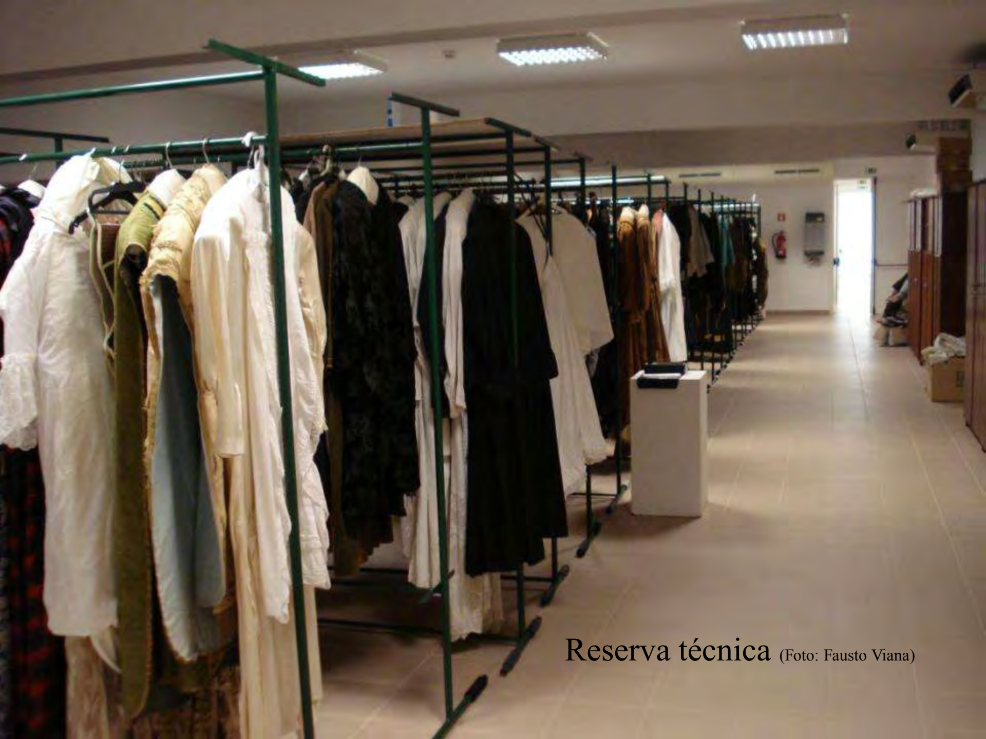
Reserva técnica