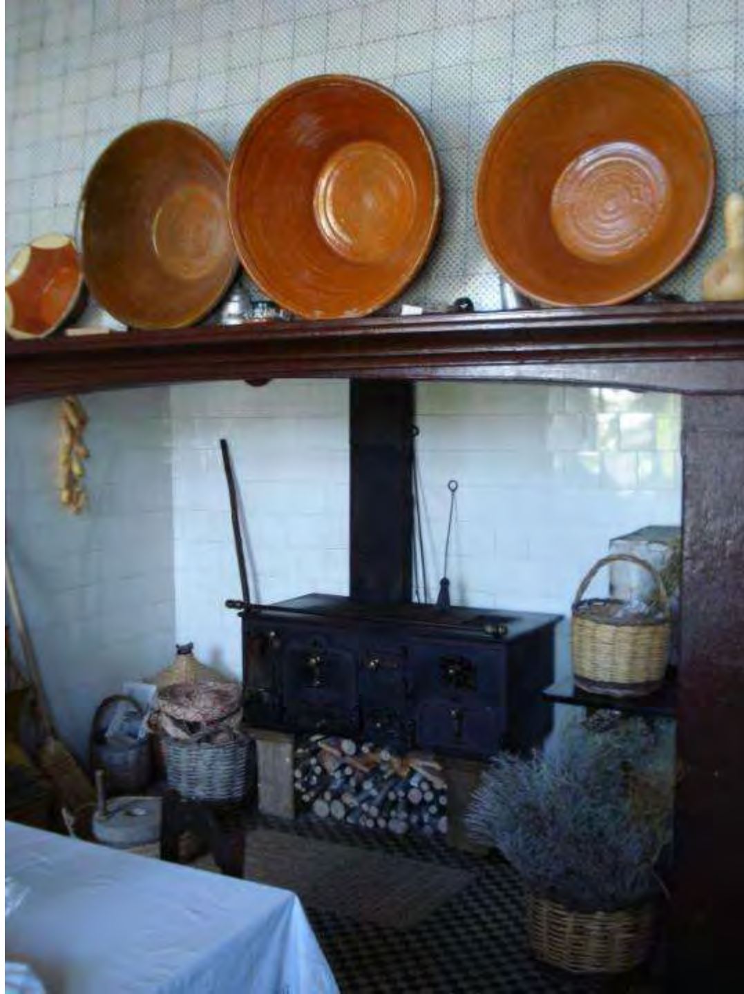
Cozinha/ Loja