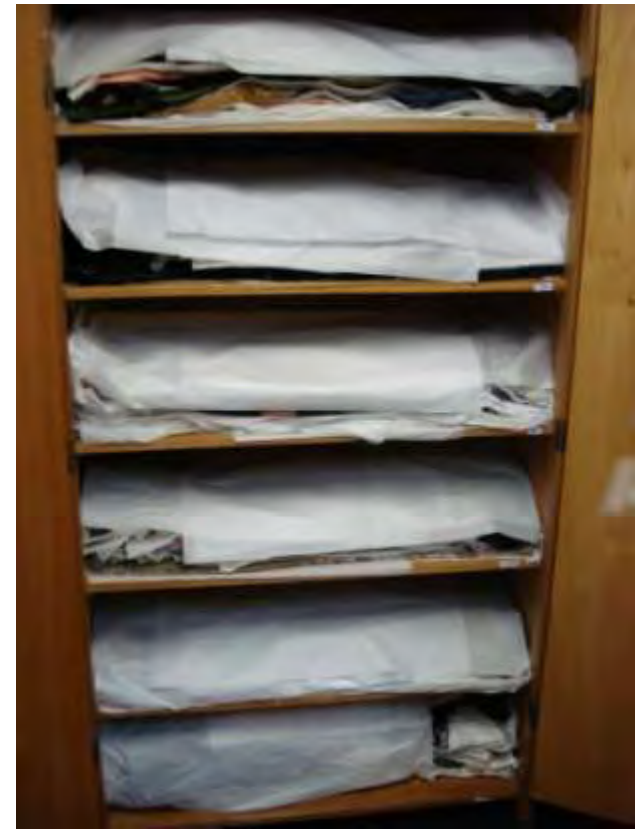
Trajes em prateleiras