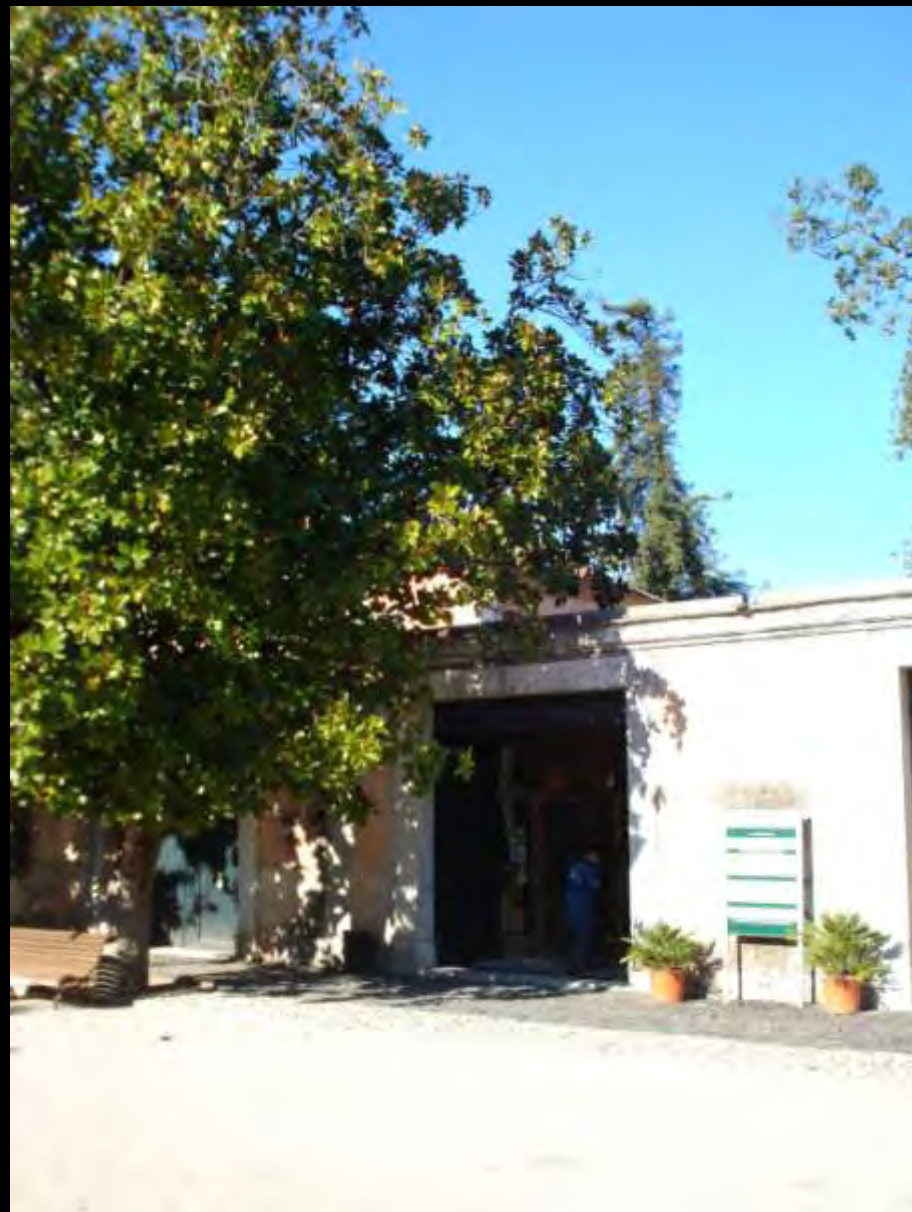
MUSEU DO TRAJE O acesso aos escritórios e à sala dos teares/ A gift shop