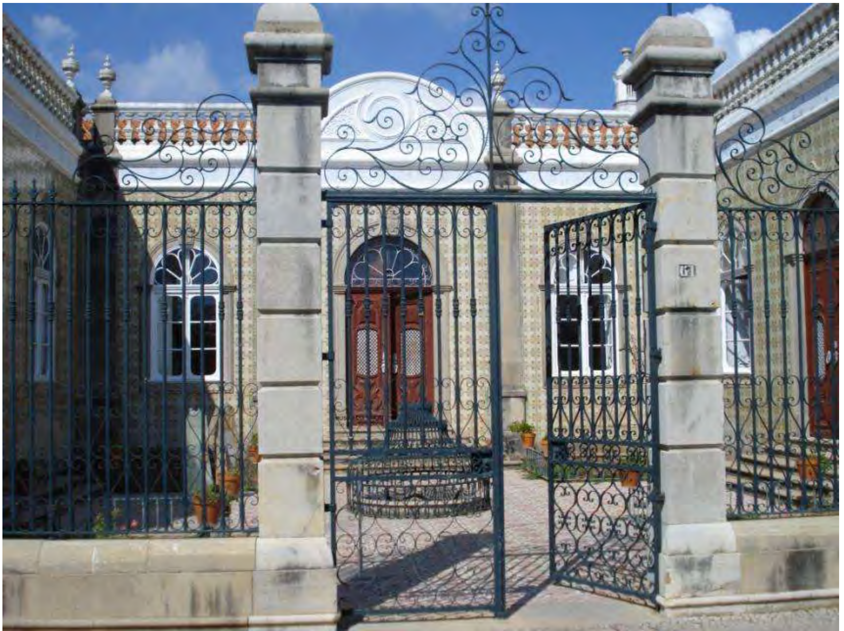
Museu do Traje de São Brás de Alportel