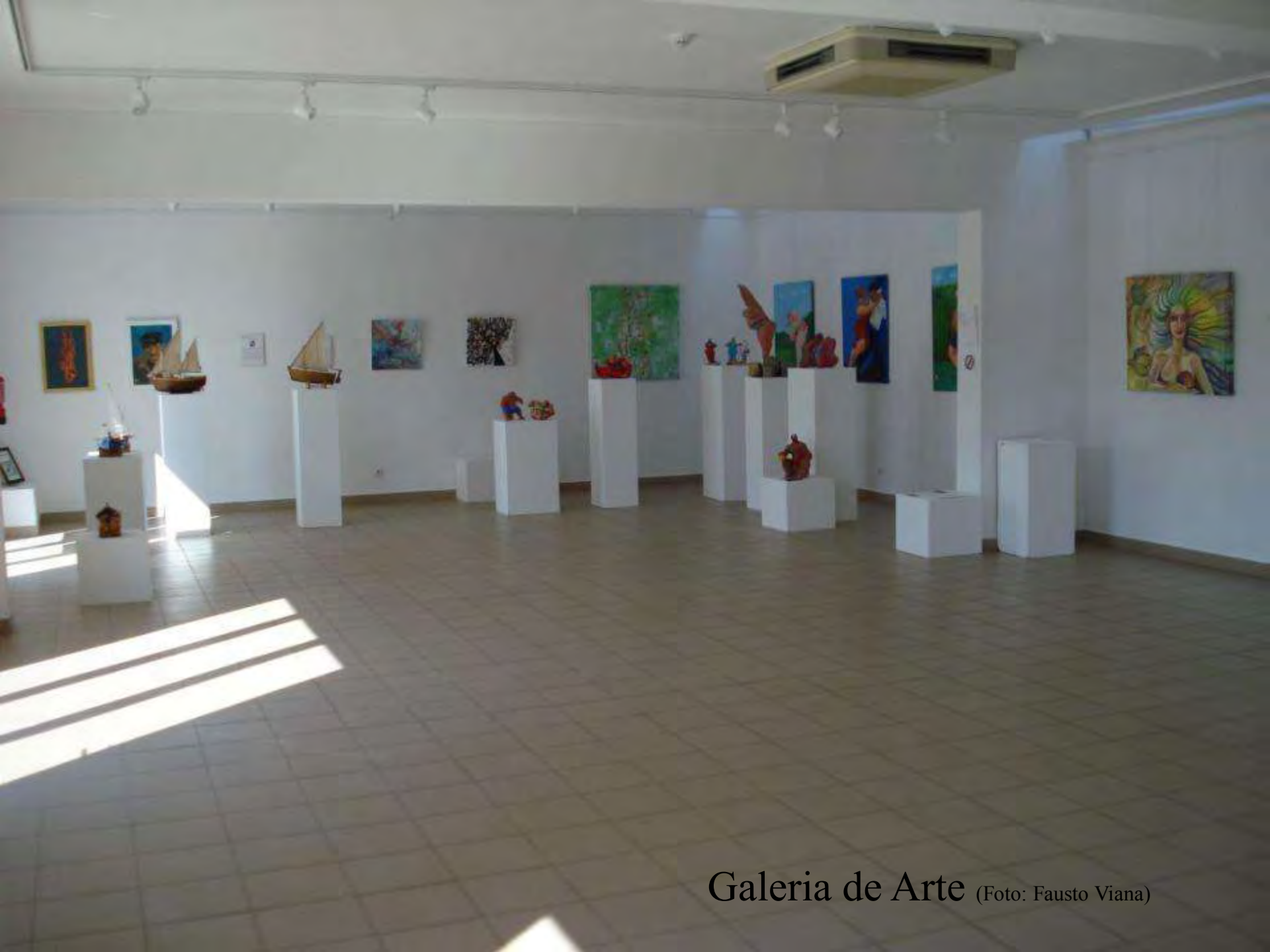
Galeria de Arte