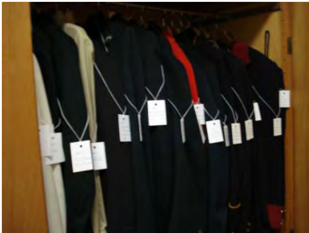
Casacos com etiqueta de identificação