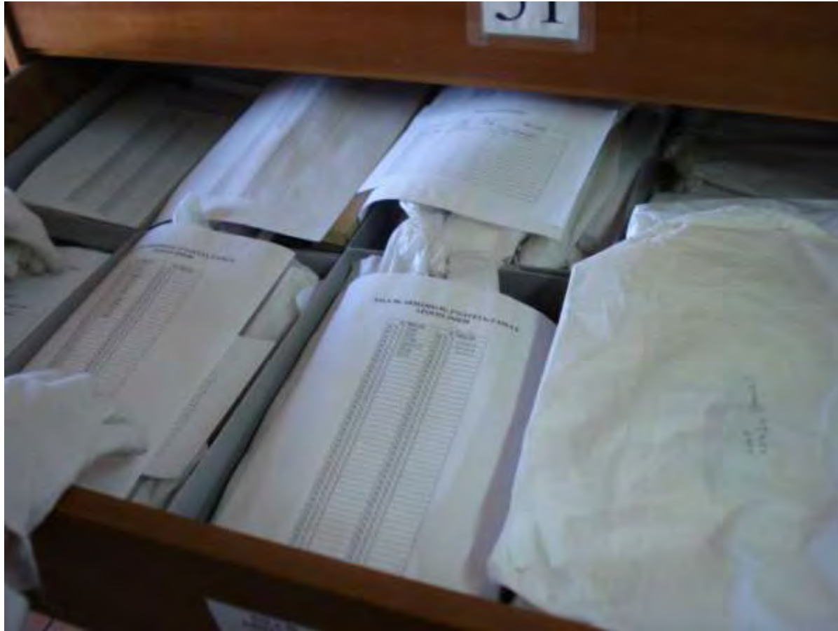
Caixas com muito material têm listas individuais