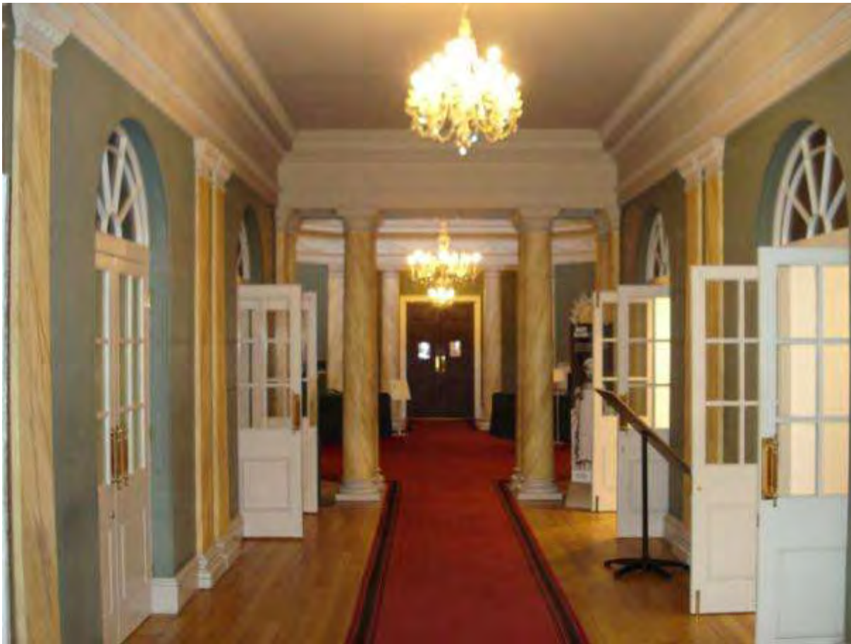
Museu da Moda de Bath