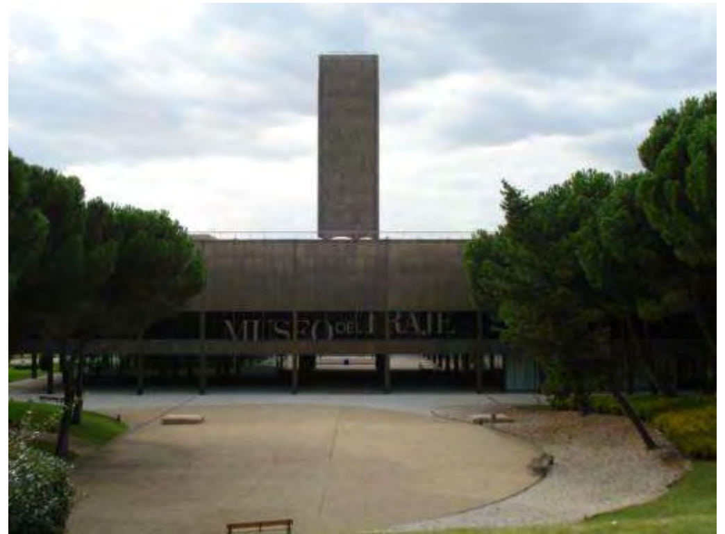
Museu do Traje de Viana do Castelo(esq.)